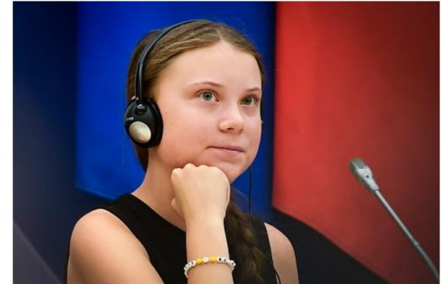
Campaigning to save the climate.

There are better ways to lower carbon emissions than sailing from Sweden to New York. By Tyler Cowen August 4, 2019, 4:00 PM GMT+3